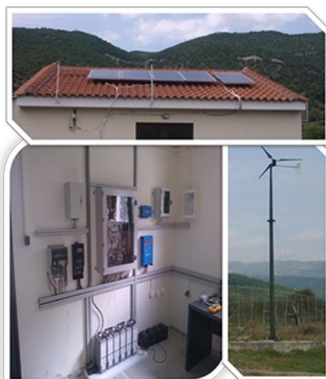
Hybrid Autonomous Renewable Energy System

Αειφόρου ανάπτυξης , οι φοιτητές εκπαιδεύονται σε θέματα οικονομικής περιβάλλοντος, τεχνικών τιμολόγησης φυσικών πόρων, πράσινης επιχειρηματικότητας, συστημάτων περιβαλλοντικής διαχείρισης (ISO 14001, EMAS, eco-label) και της επίδρασης των ψυχολογικών και κοινωνικών μεταβλητών σε θέματα προστασίας περιβάλλοντος.